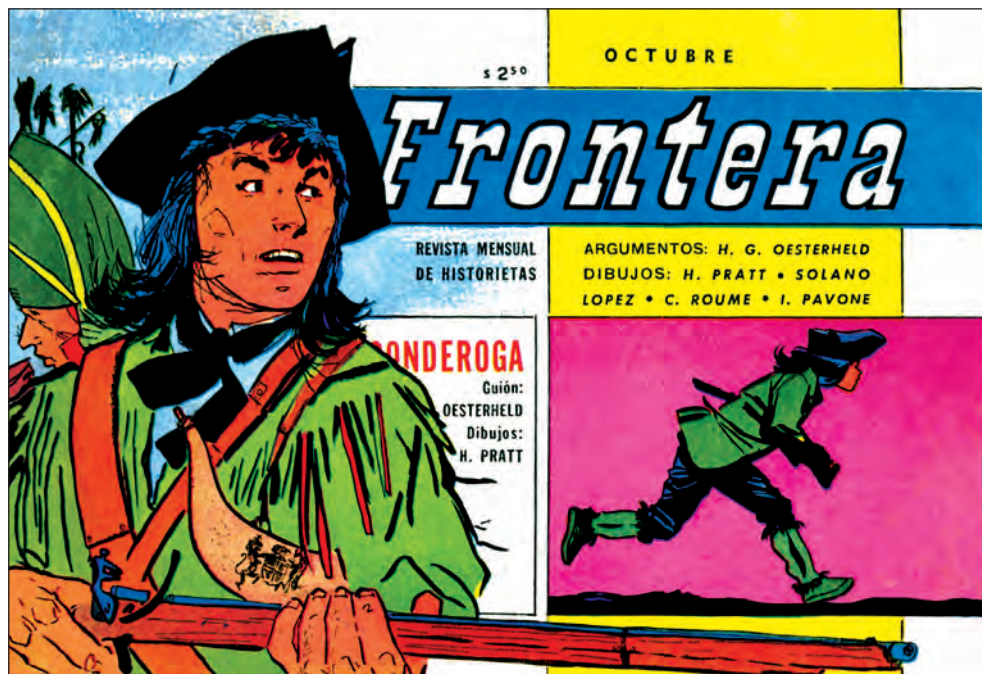
7 Ottobre 1957